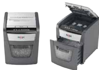
Optimum AutoFeed+ 50X P-4