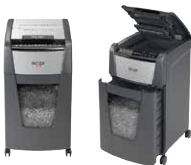
Optimum AutoFeed+ 225X

Niszczarki z podajnikiem automatycznym AutoFeed są odpowiednią na badania wskazujące, że 53% pracowników biurowych niszczy dokumenty partiami.